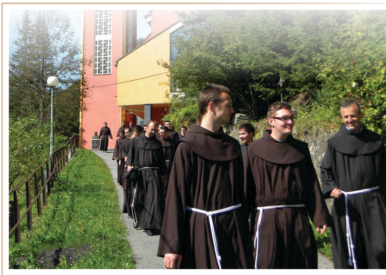
pripremili: fra Nikola Livaja i fra Stjepan Orkić

Cijelo vrijeme susreta obilježila je bratska atmosfera i upoznavanje i povijesti te drevne institucije, provincije Bosne Srebrene, kao i današnje djelovanje bosanskih pastira.